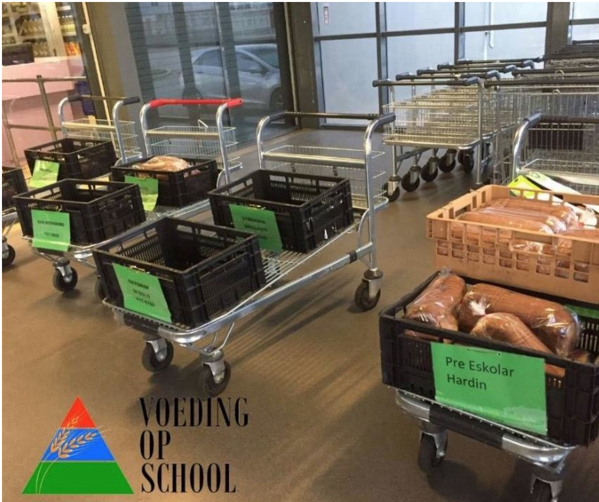
Foto: ontbijtpakketten staan iedere morgen om 6.30 uur klaar bij Bonaire Food Group.